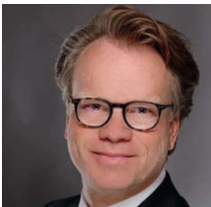
Carl-Jan von der Goltz Maturus Finance GmbH