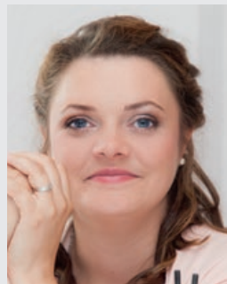
Kathrin de Blois Haaß Sanitär Heizung, Mönchengladbach