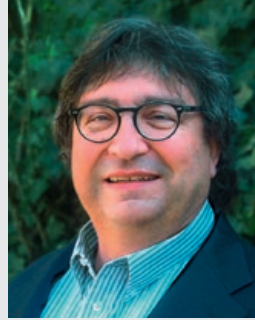
Thomas Huber Cassing GmbH, Düsseldorf